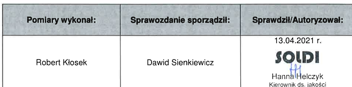
Tabela nr 5

W wyniku zastosowania sposobu sprawdzenia dotrzymania dopuszczalnych poziomów pól elektromagnetycznych w środowisku, zgodnie z pkt 25 ppkt 1 Rozporządzenia Ministra Klimatu z dnia 17 lutego 2020 r. w sprawie sposobów sprawdzania dotrzymania dopuszczalnych poziomów pól elektromagnetycznych w środowisku [Dz. U. 2020, poz. 258], stwierdza się, że w obszarze pomiarowym rozpatrywanej instalacji radiokomunikacyjnej we wszystkich punktach / pionach pomiarowych żadna z wartości wskaźnikowych nie przekracza wartości 1, w związku z czym w punktach tych należy uznać za dotrzymane dopuszczalne poziomy pól elektromagnetycznych w środowisku. Stwierdzenie zgodności zostało przedstawione na podstawie wyników badań oraz informacji uzyskanych od klienta (za które Laboratorium nie ponosi odpowiedzialności) dla instalacji opisanej w punkcie 5 przy uwzględnieniu pozostałych źródeł promieniowania.