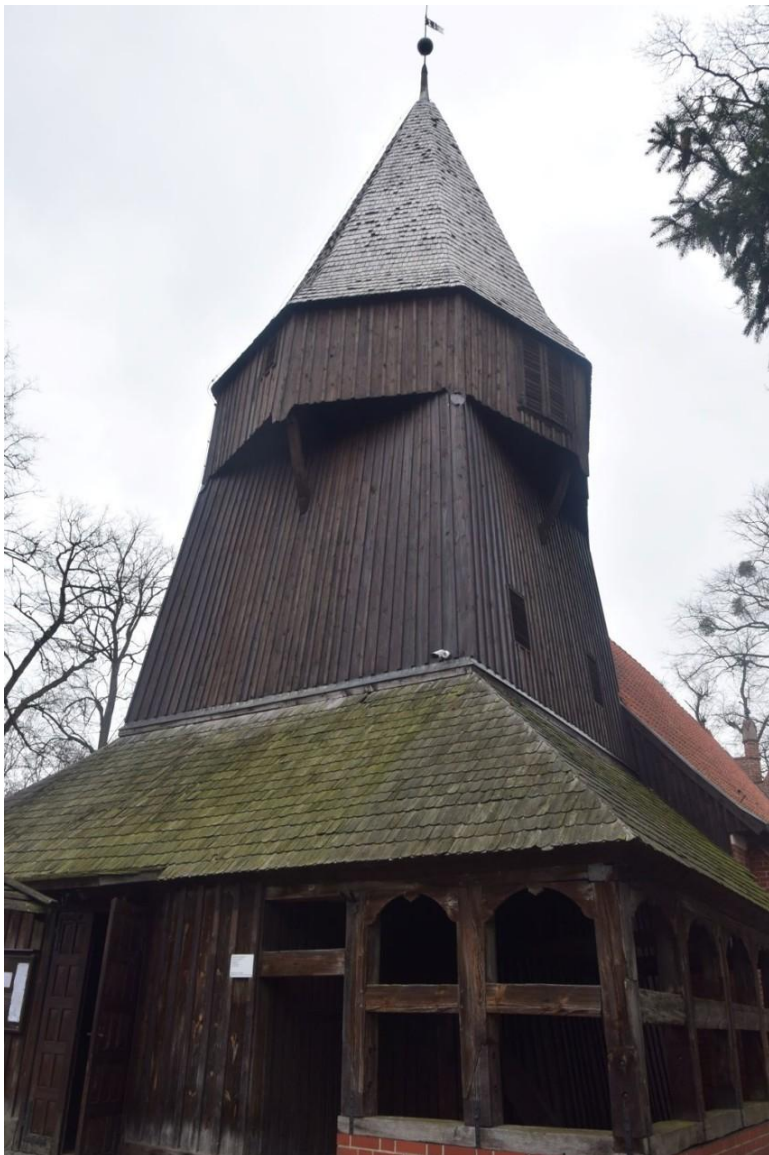
Kościół w Kmiecinie – soboty przed remontem